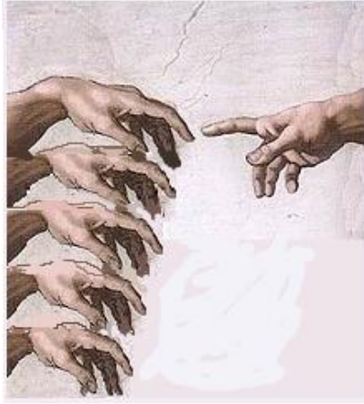
Şəkil 2. Müasir müəllif klonlaşdırmanı Tanrıdan qaynaqlanan anlayış kimi təsvir etməyə çalışır – sağdakı əl Allahın əlidir.

Bu təsvir klonlaşdırmanın guya ilahi mənşəli olduğu ideyasını irəli sürürdü. Bibliya istinadlarına əsasən fərziyyələr yarandı ki, Tanrı Adəmi torpaq materialından klonlaşdırmış, sonra onun qabırğasından götürülmüş somatik hüceyrədən Həvvanı yaratmışdır. Dollinin doğulmasından sonra klonlaşdırma ideyası elmi-fantastik ədəbiyyat və kinoda əsas mövzulardan birinə çevrildi.