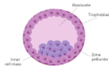
Şəkil 4. Blastosist

Römerin üçüncü “klonu” da eyni dərəcədə qeyri-təbii görünür: